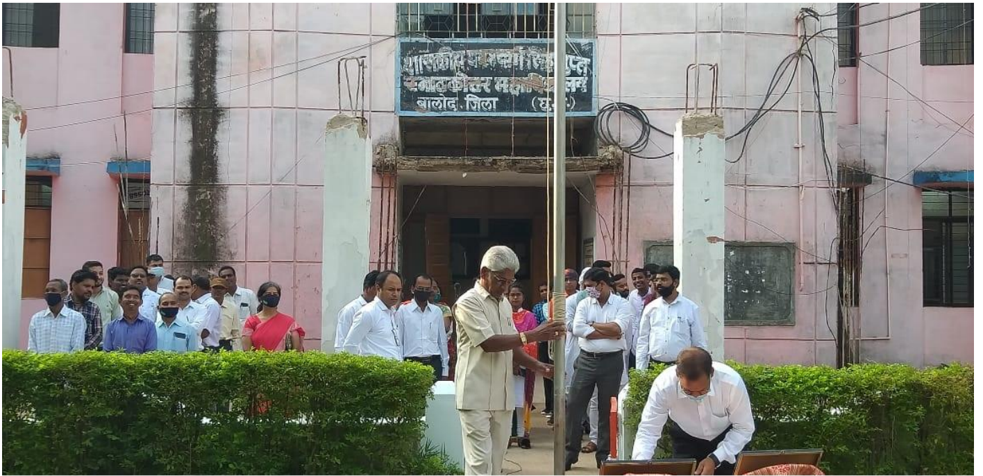
Republic Day Celebration