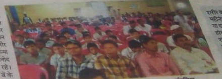
टाउनहॉल में एड्स जागरूकता कार्यक्रम में जुटे बच्चे और युवा। ● नईदुनिया

एसपी ने कहा कि एड्स एक लाइलाज बीमारी है। दवा के जरिए मरीज के जीवन को बचाया जरूर जा सकता है। उन्होंने कहा कि एड्स रोगियों के साथ सामान्य व्यक्तियों जैसा ही व्यवहार करें। ये छुआछूत का रोग नहीं है। लोगों में एचआईवी के प्रति जागरूकता लाने के