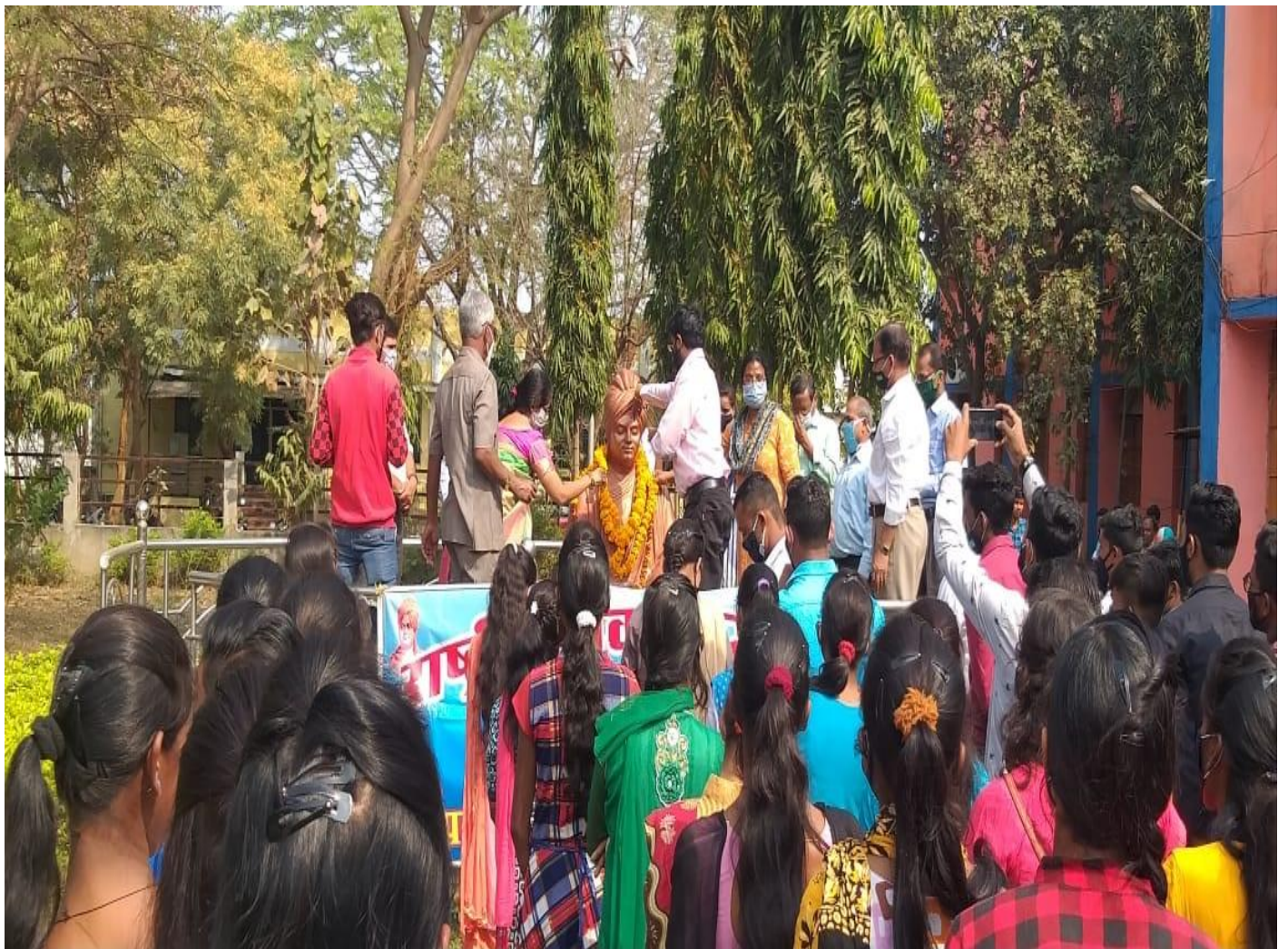
Swami Vivekanand Jayanti