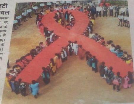
जागरूकता कार्यक्रम के दौरान टाउनहॉल में रेंडरिबन के साथ जुड़े लोग।