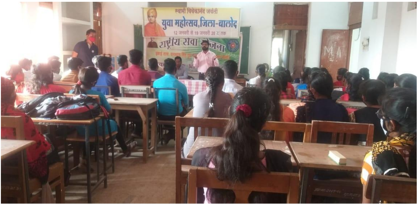
Swami Vivekanand Jayanti