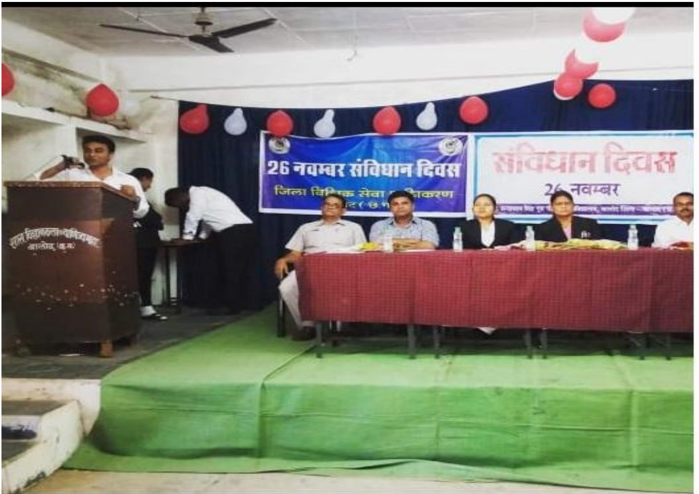
Constitution Day Celebration